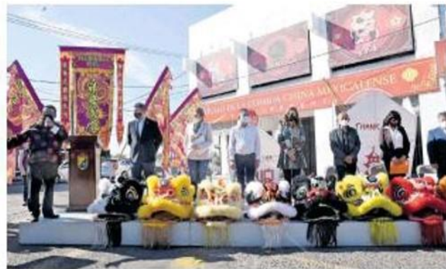
La celebración del Día de China en Mexicali se cumplió ayer siguiendo los protocolos sanitarios

Tan solo el Instituto Municipal del Deporte y de la Cultura Física (Imdecu) y el Instituto Municipal